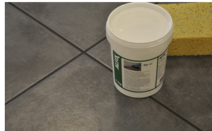
Tvätta slutligen med Syr' á

Ytan får tidigast övertäckas efter 1-2 dygn, endast med lämplig kartong, ej plastfolie.