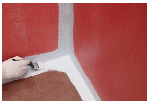
Påføring af Alfix Tetningsmasse

Alfix 1K eller 2K Tetningsmassen påføres underlaget som et heldekkende porefritt sparkellag i en tykkelse på ca. 0,8 mm.