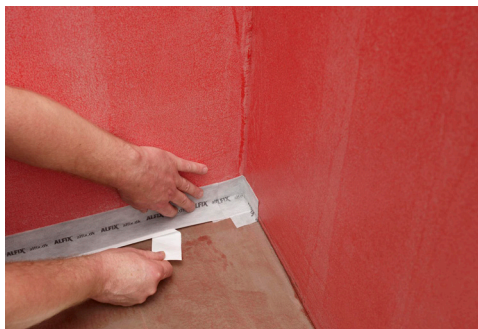
Tetning ved lodrette hjørner og overgang vegg/gulv