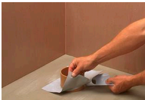
Tetning med Alfix Slukmansjett ved rørgjennomføring