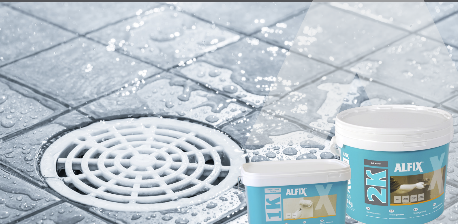
Alfix 1K Tætningsmasse