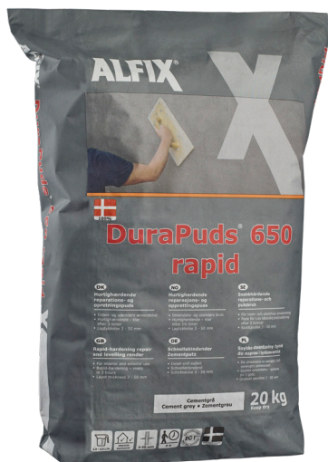
Alfix DuraPuds 650 rapid