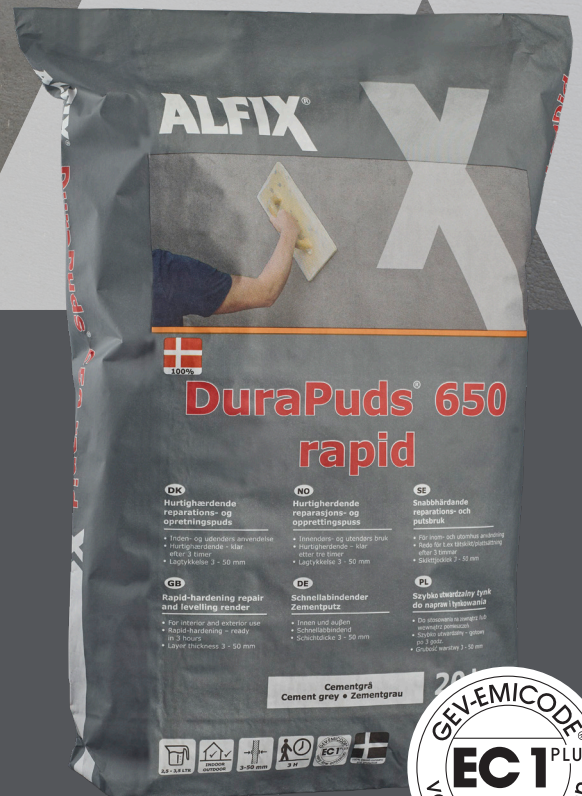
Alfix DuraPuds 650 rapid