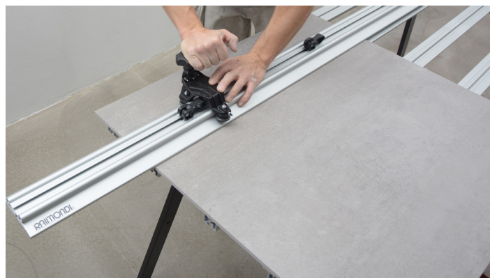
Opridsing av flise med styreskinne