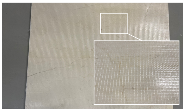
Flise belagt med epoksy-nettforsterkning

Hvis punkt B velges, bortfaller Alfix A/S produktgaranti i forbindelse med bom og løse fliser på grunn av vedheftsbrudd mellom flislim og epoksybelegg.