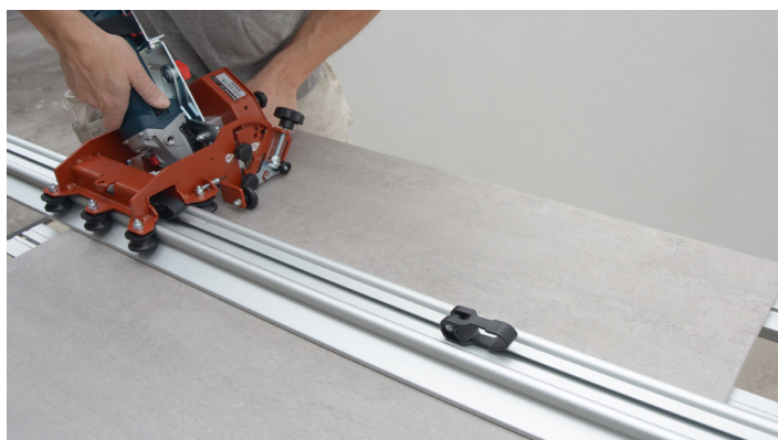
Skjæring av flise etter styreskinne