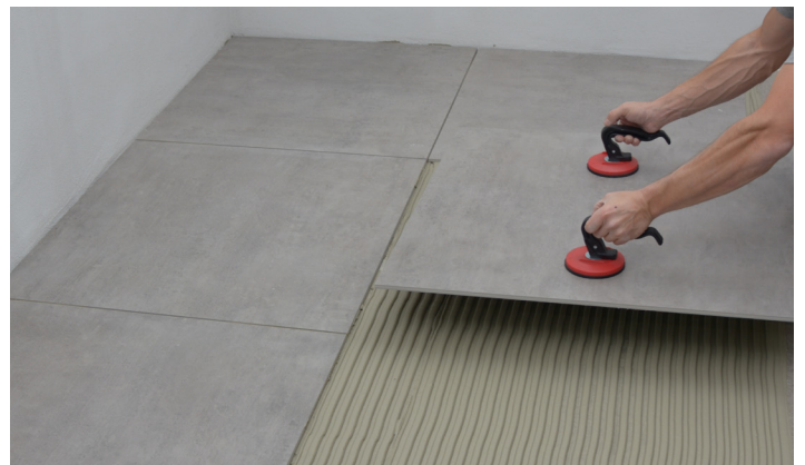
Montering av flise med sugekopper

Avbindingstiden ved storformatfliser er normalt langsommere på grunn av det lille fugearealet. Store flisarealer og bindertilsetning vil også forlenge tørke- og herdetiden. Vi anbefaler at de retningsgivende avbindingstidene fordobles ved fuging.