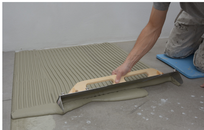
Påføring av flislim på underlaget

Ved bruk af kile- eller nivelleringsystem må det generelt brukes tannsparkel på min. 12 x 12 mm til påføring på underlaget samt 4 x 4 mm tannsparkel til påføring på flisens bakside.