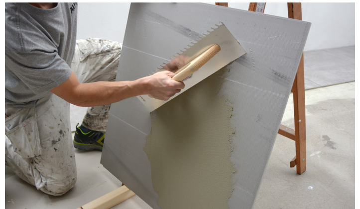
Flislimet påføres baksiden av flisen (baksmøring)

Eventuel overflødig lim i fugene skrapes ut. Kontroller at lagtykkelsen er tilstrekkelig ved å vippe opp en flis. Vær oppmerksom på at dekningen til limet er vanskeligere å avgjøre når det brukes baksmøring av flisen.