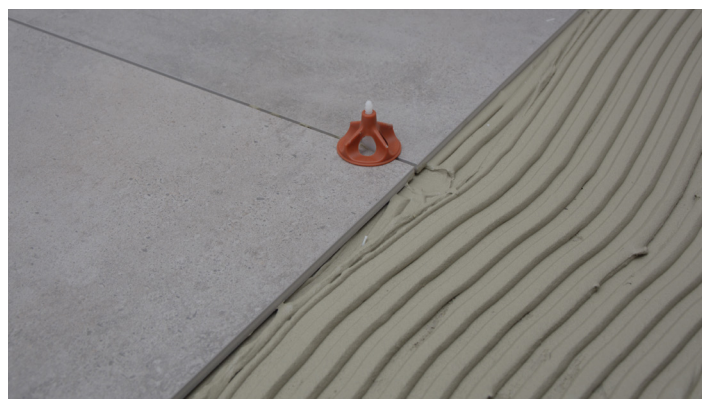
Eksempel på nivelleringsystem til fliser