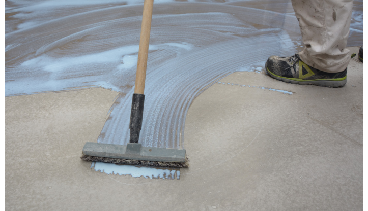
Priming av gulv

Fliselimet påføres underlaget med tannsparkel med den valgte tannstørrelsen. Først med den glatte siden og deretter dras tannsidene over. Sparkelen holdes ned mot underlaget i samme retning og vinkel for å oppnå en ensartet påføring.