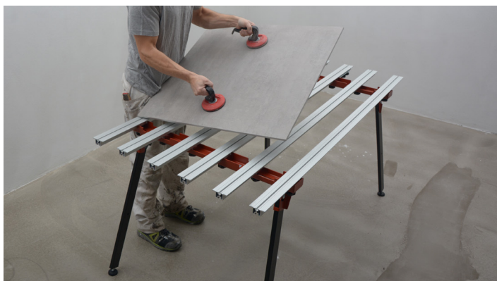
Sugekopper til håndtering av store fliser