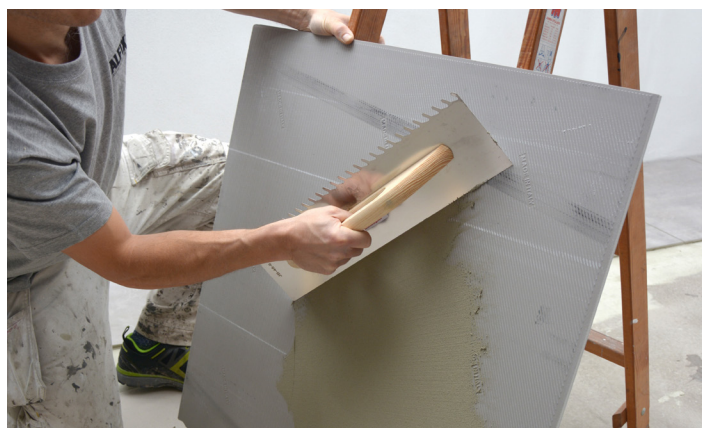
Påføring av flislim på flisens bakside

Ved fliseformat med kantlengde på over 600 mm anbefaler vi baksmøring (Buttering-floating-metoden), dvs. at det påføres flislim både på flisens bakside og underlaget.