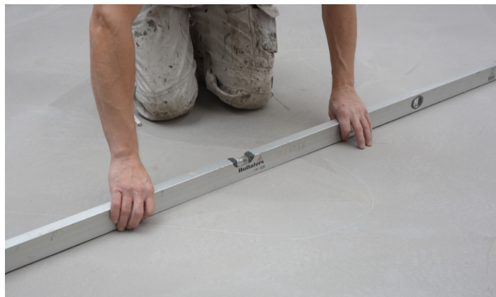
Kontrol av underlagets planhet

Hvis det brukes Alfix PlaneMix sparkelmasser, forbehandles (primes) alltid underlaget først med Alfix PlaneMixPrimer.