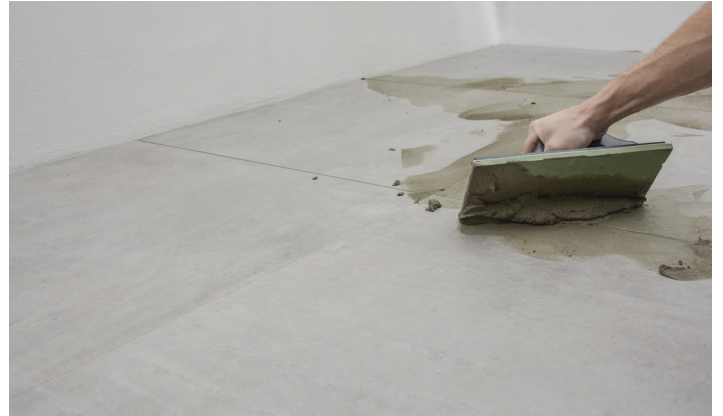
Påføring av fugemasse

Fugene fyldes helt og glittes inden 15 minutter med glittesett, våt trepinne eller stålsparkel.