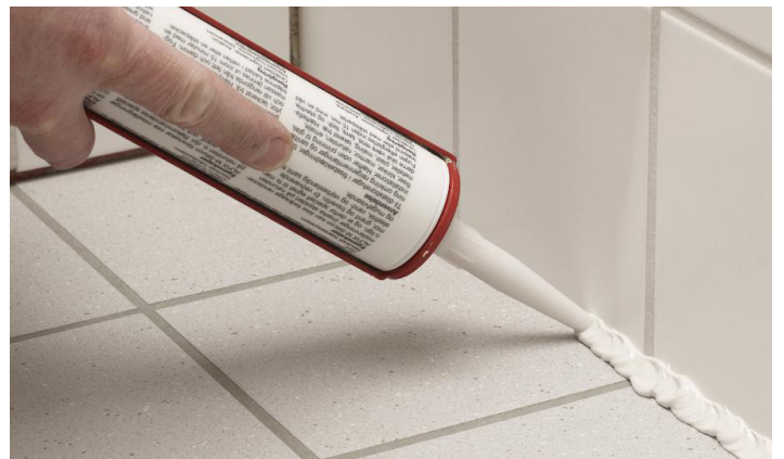
Påføring av silikonefugemasse