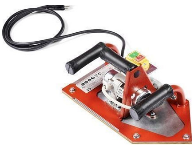
Flisvibrator for å optimere dekningen til limet.

Flisene presses/bankes på plass i det fuktige limet innen ca. 20 minutter. Brukes kiler eller nivelleringskopper monteres disse umiddelbart deretter.