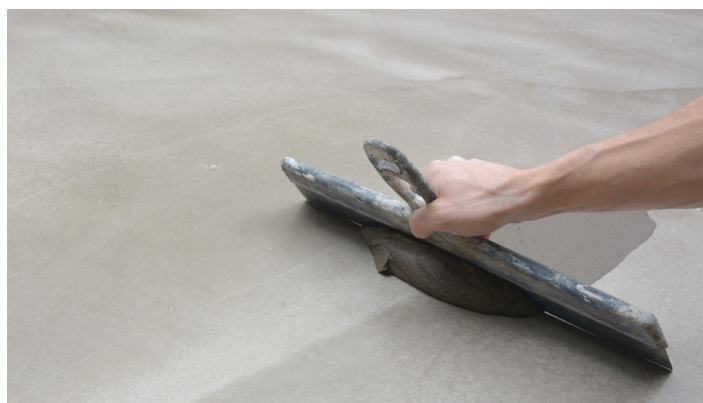
Opretting av ujevnheter