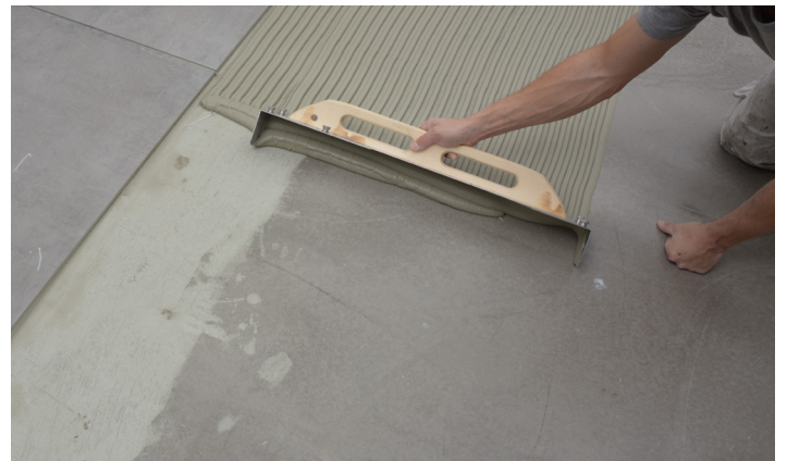
Flislim trekkes på underlaget

Det er viktig at tannsparkelribbene på flisens bakside er parallelle med tannsparkelribbene på underlaget. Alternativt kan ribbene på flisens bakside glittes med den glatte side af sparklen til en plan overflate.